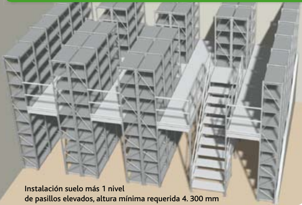
Instalación suelo más 1 nivel de pasillos elevados, altura mínima requerida 4.300 mm