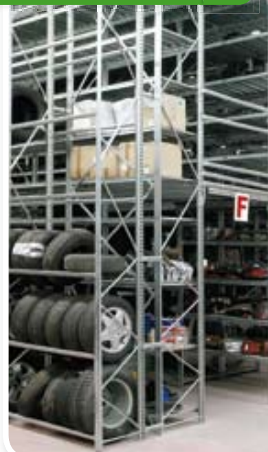
Gran variedad de estantes y accesorios, adaptándose por zonas al tipo de material a almacenar y a los diversos pesos de las piezas.