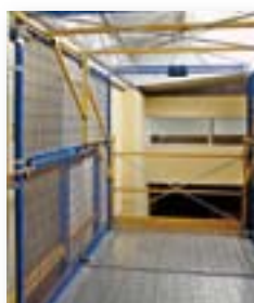
● posición cerrada