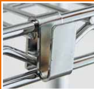
Los módulos adicionales incluyen las piezas en "S" para una perfecta sujeción.

Para esas mercancías que Ud. desea destacar o para almacenar objetos que están a la vista. Para comercios, tiendas de regalo, boutiques de moda... Además de almacenar, decoran.