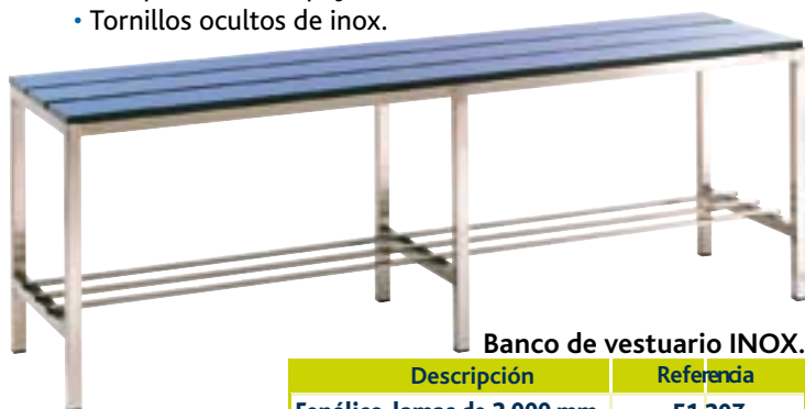
Banco de vestuario INOX.