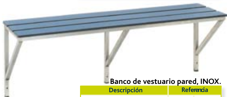
Banco de vestuario pared, INOX.