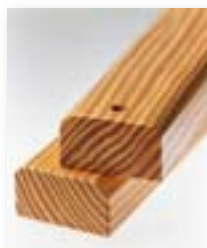
Listones de madera.