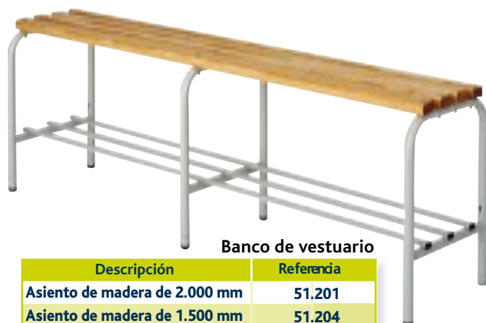
Banco de vestuario