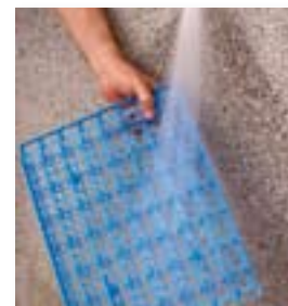
Fácil limpieza con agua a presión o lavavajillas.