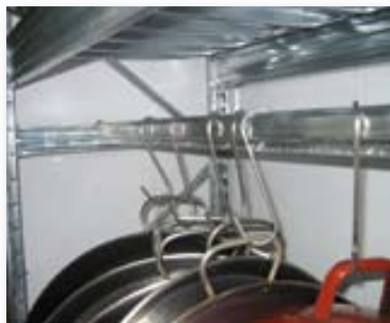
Accesorio: barra colgadora interior.