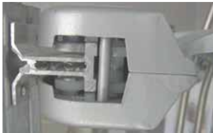
Detalle de la sección del rail guía y la pieza móvil en posición