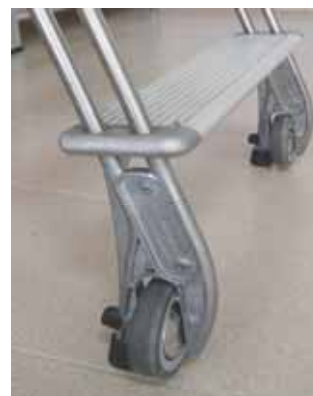
La escalera en posición vertical apoya sobre las ruedas. En posición inclinada apoya sobre lostacos plásticos